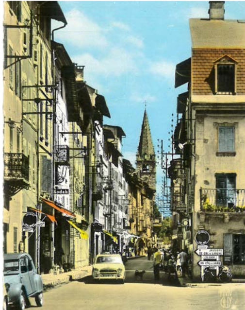
Rue Manuel en 1963.